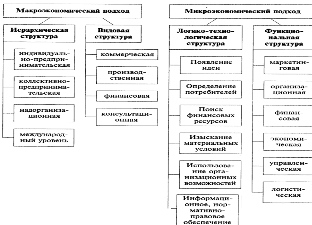
Рис. 5.1. Структурирование предпринимательской деятельности

Видовой подход, или структура видов предпринимательской деятельности в национальной экономике, также служит своеобразным индикатором уровня развитости той или иной страны. Производственное предпринимательство можно назвать ведущим видом предпринимательства: здесь осуществляется производство продукции, удовлетворяющей самые разнообразные потребности, оказываются услуги, в том числе информационно-интеллектуального характера, создаются духовные ценности. Чем более развито производственное и финансовое предпринимательство, тем более в целом экономически развита страна. При переходе наиболее развитых стран на постиндустриальную стадию развития основной сферой деятельности производственного предпринимательства становится сфера услуг при расширении сферы финансового предпринимательства. Разнообразные формы финансового предпринимательства втягивают в рыночные отношения все больше хозяйствующих субъектов.