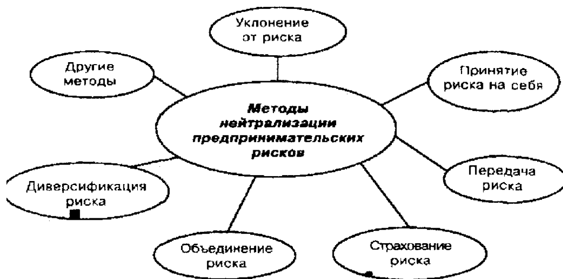
Рис. 6.4. Методы нейтрализации предпринимательских рисков

Система методов нейтрализации предпринимательских рисков изображена на рис. 6.4.