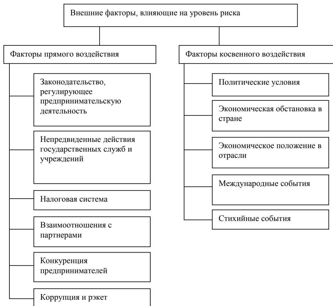
Рис. 6.2. Внешние факторы, влияющие на уровень риска

Поскольку риск имеет объективную основу из-за неопределенности влияния среды и субъективную основу в результате принятия решения самим предпринимателем, успехи и неудачи предпринимательской фирмы следует рассматривать как взаимодействие целого ряда факторов, одни из которых являются внешними по отношению к предпринимательской фирме, а другие — внутренними. Под внешними факторами понимаются те условия, которые предприниматель не может изменить, но должен учитывать, поскольку они сказываются на состоянии его дел.